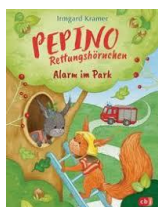
von Irmgard Krammer

Die Online-Lesungen gaben einen guten Einblick in das Leben der Autoren und war eine grosse Bereicherung.